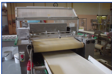
MACCHINA LAVORAZIONE PASTA

Industrie alimentari in genere, mense, scuole, bar, ristoranti, panetterie, pasticcerie, gelaterie, macellerie, salumerie, ecc.