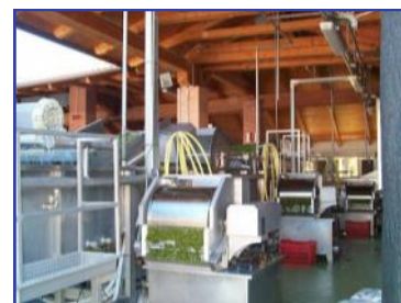
LUBRIFICANTE PROTETTIVO PER SETT. ALIMENTRE