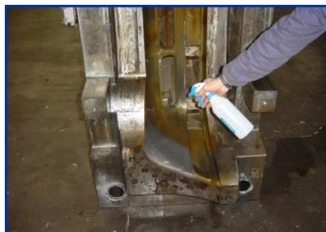
STAMPO SETTORE AUTOMOBILISTICO

NOTA: dopo l'utilizzo su materiali come acciaio, alluminio, cromature e pavimentazioni, si consiglia risciacquo e passivazione.