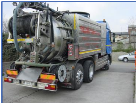
CAMION DEGLI SPURGHI