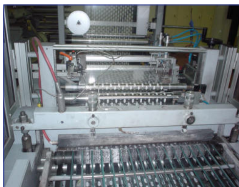
LAVORAZIONE FILM PLASTICO BARRA TERMOSALDANTE

Eccezionale distaccante per: rulli, stampi, scivoli, guarnizioni, ecc.